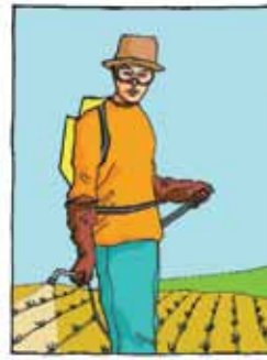
გარეცხეთ ტანსაცმელი და აპარატურა მუშაობის შემდეგ